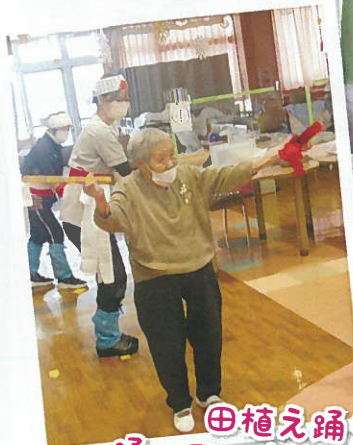
田植え踊りを踊っていただきました★