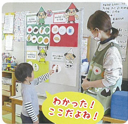
わかった！ ここだよね！