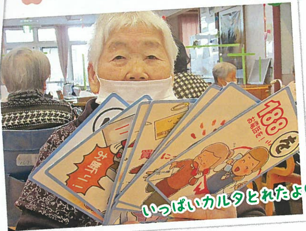
いっぱいカルタとれたよ♡