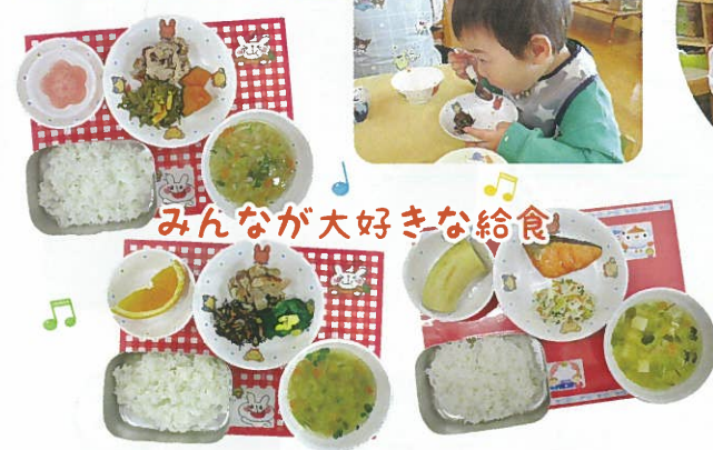
みんなが大好きな給食