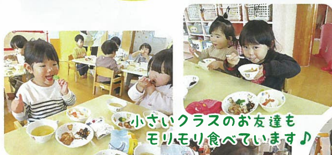
小さいクラスのお友達も もりもり食べています♪