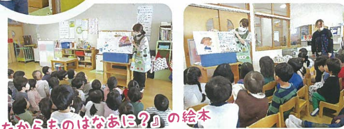
『だからものはなあに？』の絵本