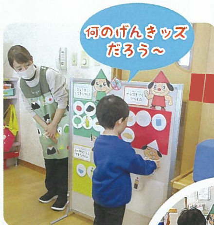
何のげんきツズ だろう～