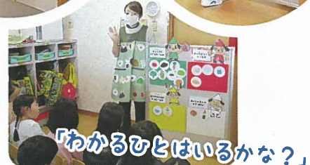
「わかるひとはいるかな？」