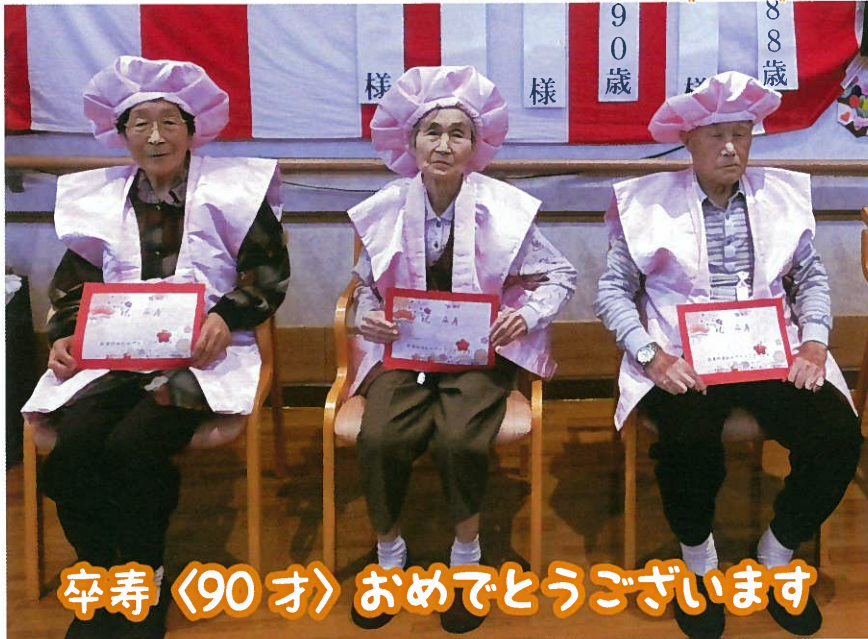
卒寿〈90才〉おめでとうございます