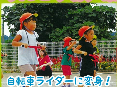
自転車ライダーに変身!