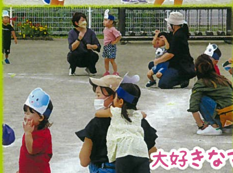
大好きなママにゴール♡