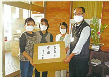
雑巾の寄贈 ありがとうございました。

行事予定 11・12月 ホーム…………… 12月25日 ● クリスマス会 デイサービス…………… 11月14日 ● 映画鑑賞会 12月19日～24日 ● クリスマス会