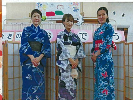
敬老おめでとうございます

9月15日〜21日まで敬老会が行われました。デイサービスでは16名の方々が、長寿のお祝いを受けました。余興では、ご利用者の方による股旅もの踊り「さんさ時雨」「荒城の月」「謡い」が披露され、大変盛り上がりアンコールされるほどでした。また、職員による「盛岡さんさ踊り」は大鼓や衣装が本格的で、みなさんに喜んでいただきました。 「コロナで地区の敬老会も無くなっちゃったから、ここで敬老会をしてもらって、たんだいがったあ〜」との声が数多く聞かれ、賑やかな会となりました。 (介護職員 津田)