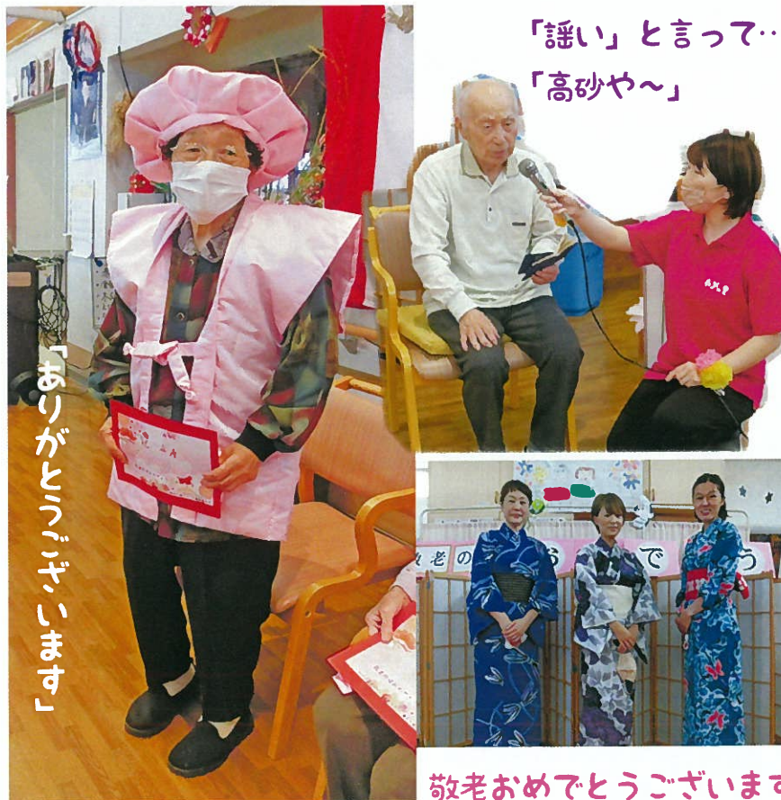
「謡い」と言って… 「高砂や〜」