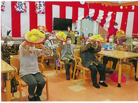
「めでためでた〜の〜♪」 (花笠音頭)