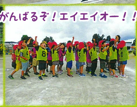
がんばるぞ! エイエイオー!!