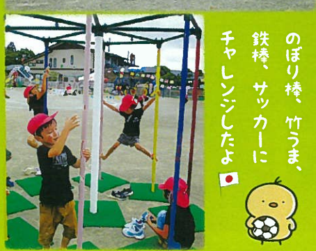
のぼり棒、竹うま、鉄棒、サッカーにチャレンジしたよ