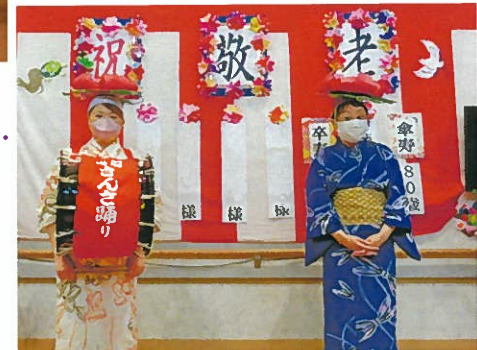
わがの里のさんさ ご覧あれ